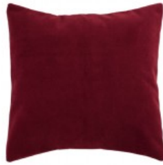
Cojín terciopelo granate