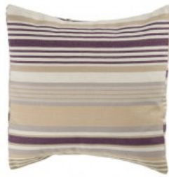
Cojín rayas lila