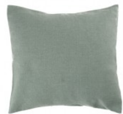
Cojín verde grisáceo