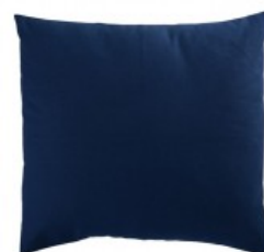
Cojín chintz azul tráfico