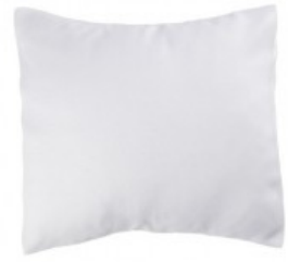
Cojín bigor visión blanco