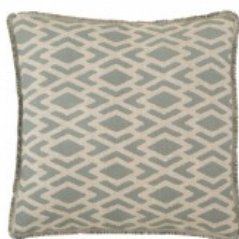
Cojín verde cenefas