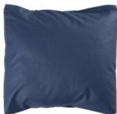
Cojín azul marino