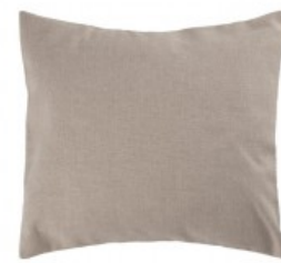
Cojín lino piedra rústico