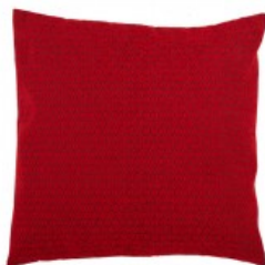
Cojín rojo trama