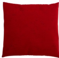
Cojín rojo flisé