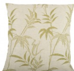
Cojín palmeras beig y verde