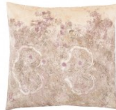
Cojín terciopelo cachemir rosado