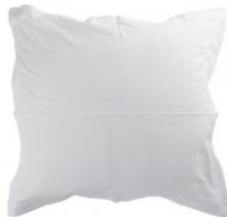
Cojín blanco blonda