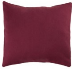
Cojín granate satén