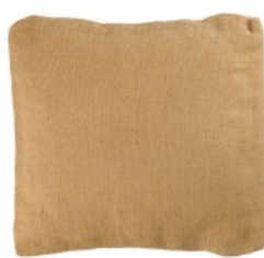
Cojín tela de sacco