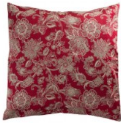
Cojín flores cachemir rojas y doradas