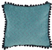
Cojín verde trama rectangular bolas