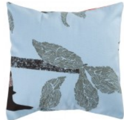
Cojín azul cielo dibujo