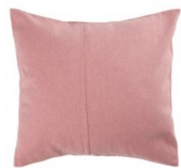
Cojín rosa palo