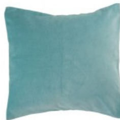
Cojín terciopelo verde