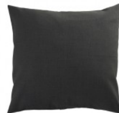
Cojín gris textura