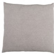
Cojín lino gris