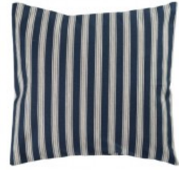
Cojín crudo rayas azules