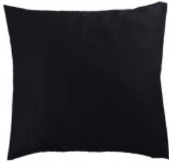
Cojín bigor visón negro