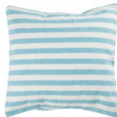
Cojín rayas turquesa