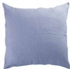
Cojín lino azul celeste