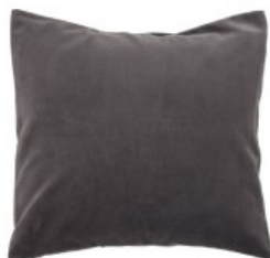
Cojín terciopelo gris