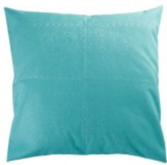
Cojín verde agua