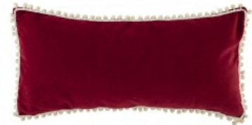
Cojín terciopelo granate bolitas beig