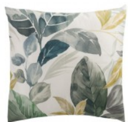
Cojín hojas verdes