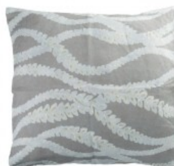
Cojín gris plantas aguamarina