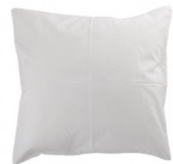
Cojín blanco algodón