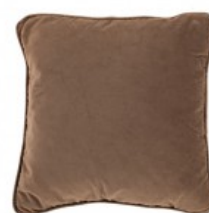
Cojín terciopelo marrón