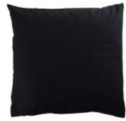
Cojín negro algodón