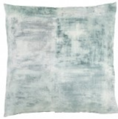
Cojín terciopelo verde grisáceo