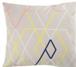
Cojín beig rayas cruzadas