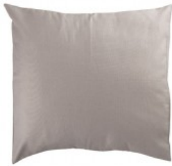
Cojín bigor visón piedra