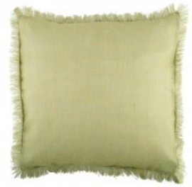
Cojín rústico verde flecos