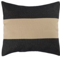
Cojín rayas beig y negras