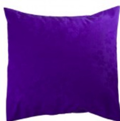
Cojín lila bordado flores