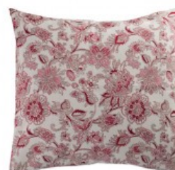
Cojín flores cachemir blanco y rojo