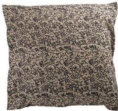
Cojín marrón plantas negras