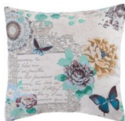
Cojín estampado mariposas