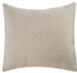
Cojín lino crudo