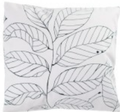
Cojín rama negra