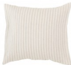
Cojín rayas tostadas y lurex