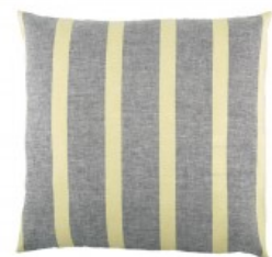
Cojín rayas amarillas y grises