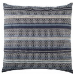
Cojín rayas azules entramadas