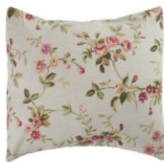
Cojín flores rojas y verdes