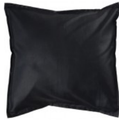
Cojín negro tafetán