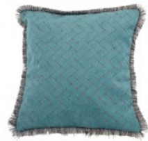
Cojín verde trama rectangular flecos