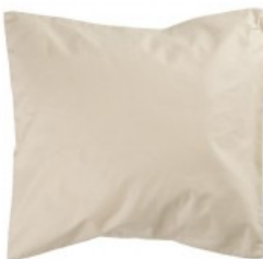
Cojín beig brillante