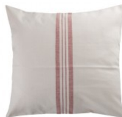
Cojín crudo rayas rojas