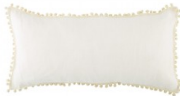
Cojín rústico bolas beig