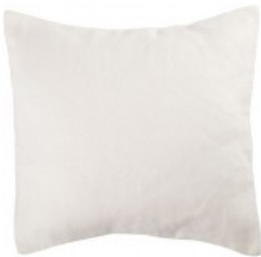
Cojín blanco lino