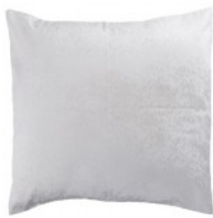
Cojín polyester blanco bordado