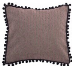
Cojín marrón trama rectangular bolas