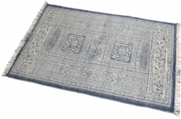
Alfombra estampada azul