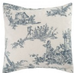
Cojín paisaje azul