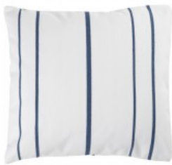
Cojín rayas azul marino