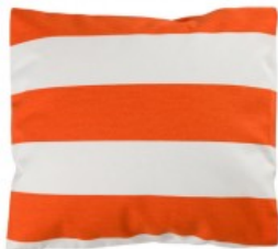
Cojín rayas naranjas