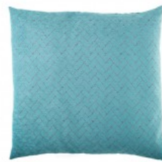
Cojín verde trama rectangular