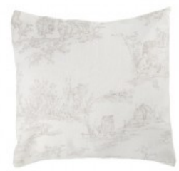
Cojín paisaje gris