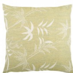
Cojín palmeras verde y beig