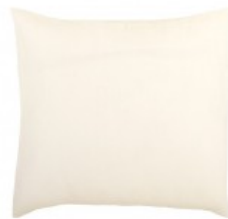
Cojín lino espiga